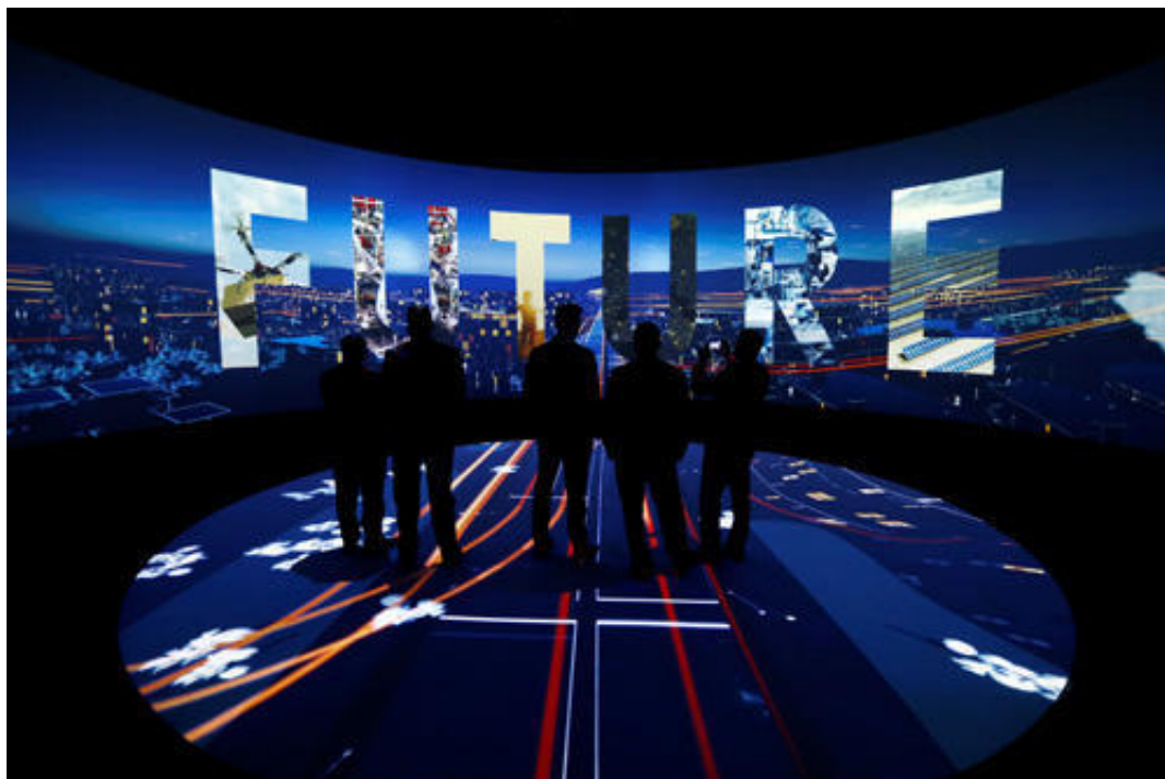
10月25日，沙特利雅得，参观者体验“NEOM”展览。

参考消息网10月28日报道 法媒称，这将是一个和其他任何地方都不一样的都市，沙特阿拉伯“新未来（NEOM）”计划的推介者们如是说。该计划称得上是沙特王储穆罕默德·本·萨勒曼的一匹新战马。