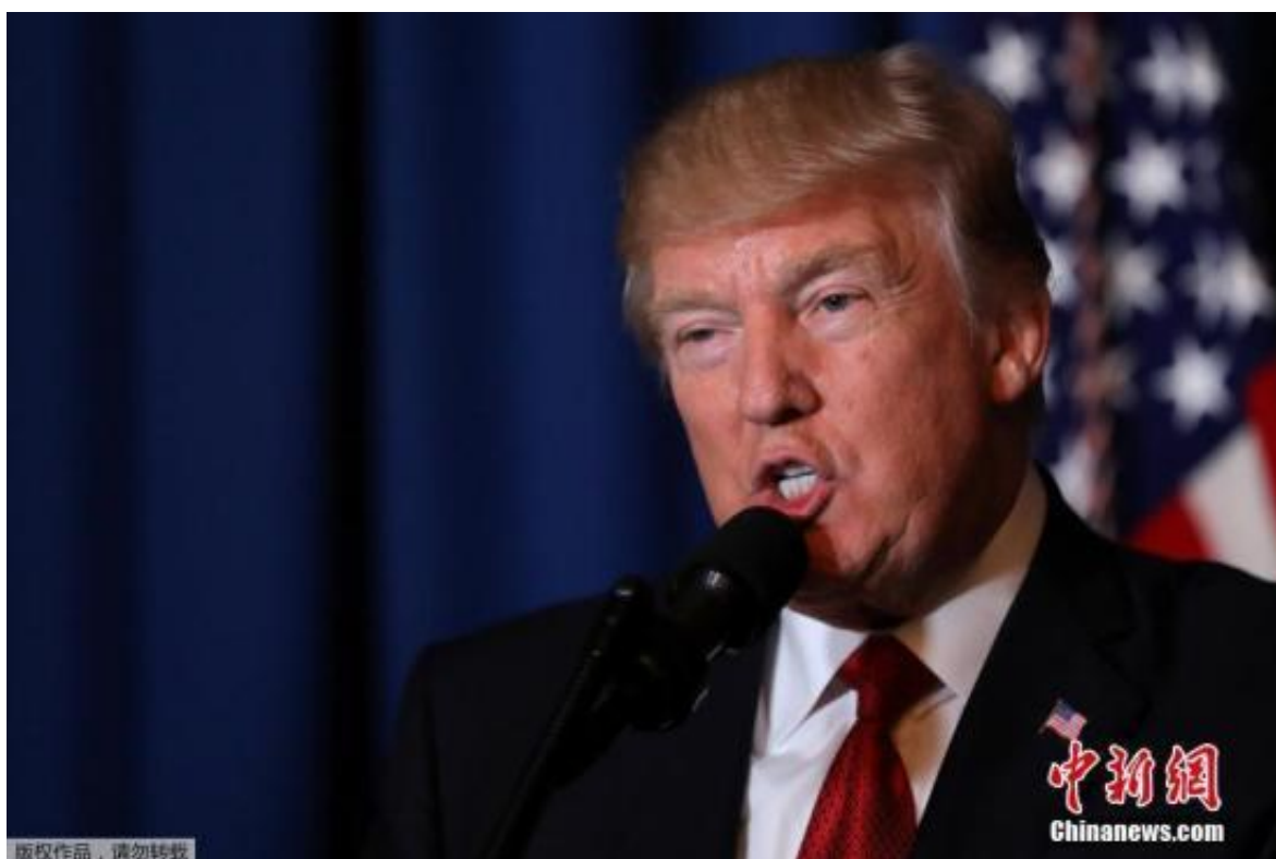
资料图：美国总统特朗普。

米勒办公室前日公开的法庭文件显示，帕帕佐普洛斯去年3月任特朗普竞选团队外交政策顾问期间，在英国伦敦与该名教授会面，对方介绍他认识一名自称俄总统普京“侄女”的女子，后者向他保证，会提供民主党前总统候选人希拉里·克林顿的“黑料”。